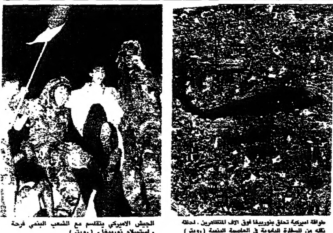
طولة اميريكية تلتق بنورينها فوق الاول القطنيين. لحظة استسلام نورينها في العاصمة البنية

بعد استسلامه في العاصمة البنية نورينها معتقل في ميامي وسيحاكمم بتهمته تهريب المخدرات الاول للاتصال بنورينها ووصل نورينها على متن طائرة شحن وسعد ذلك بخصف ساعة تقريبا توجهت اربع سيارات بديعة الى للكمة الجزيئة في ميامي واخذت داخل منطقة انتظار السيارات التي فرضت عليها حراسة امنية مشددة وركز منها نورينها انه سيدافع ببرابته من التهم المنسوبة اليه عندما يعزل امام للكمة. وقال وزير الدفاع الاميريكي ريتشارد شيني انه لم يتروم اي صفقات مع نورينها كما لا يتروم ان يستلمه. وقد لم يحميها عائلة وتكديت له وللفاتيكن بقه ان يواجها عقوبة الاعدام. ويقال وزير الدفاع الاميريكي ريتشارد شيني انه لم يتروم اي صفقات مع نورينها كما لا يتروم ان يستلمه. وقد لم يحميها عائلة وتكديت له وللفاتيكن بقه ان يواجها عقوبة الاعدام.